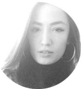
Gizem Kiziltunali Yasar University Izmir Turkey

Ally McBeal: entre la ley y el deseo. Un análisis textual del capítulo Piloto.