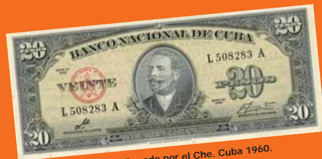
Billete de 20 pesos firmado por el Che. Cuba 1960.

a los regalos del “yuma”. Da lo mismo que sea profesional (jinetera) o amateur. Que conste que la prostitución cubana se diferencia de la que conocemos en Occidente: más que proxenetas, hay “intermediarios” o “conseguidores”. Y ellas insisten en recibir placer: rara vez Xabier se acuesta con una “fingidora”.