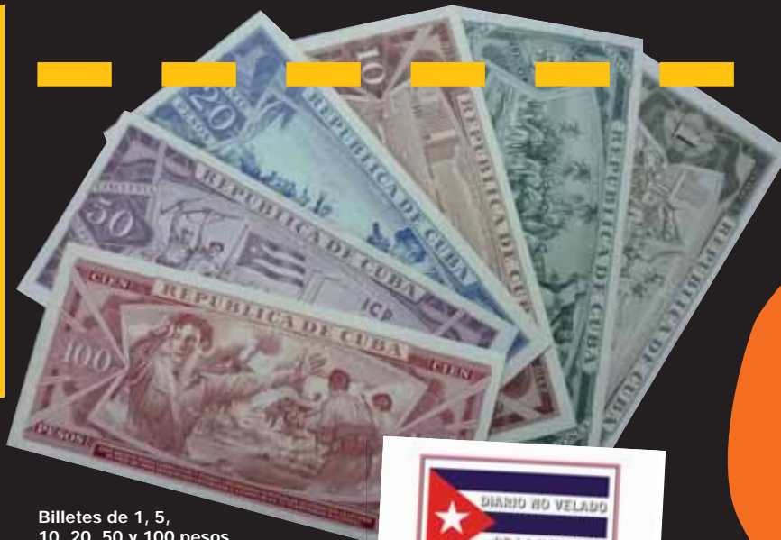
Billetes de 1, 5, 10, 20, 50 y 100 pesos firmados por el Che Guevara. 1961.

Un rincón para la novela negra, la música audaz y otras delicias legales