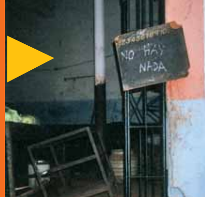
Explicito cartel en el agromercado de San Lázaro y M, en La Habana.

Le queda el consuelo de que esos "impuestos revolucionarios" se extraen con limpieza, sin violencia. Pero hay un epílogo en su libro que viene a decirnos que todo puede cambiar... a peor. De vuelta a La Habana en el 2004, le asaltan brutalmente a la salida de una discoteca; le roban desde el reloj hasta los documentos. Y pasa tres días hospitalizado, mientras cuidan de su traumatismo craneoencefálico. Cuando le interrogan agentes de la PNR, les choca su actitud: "Lo único que me importa es mi recuperación". Los policías terminan