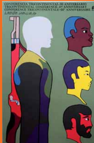
Dos obras del cartelista Alfredo G. Rostgaard.