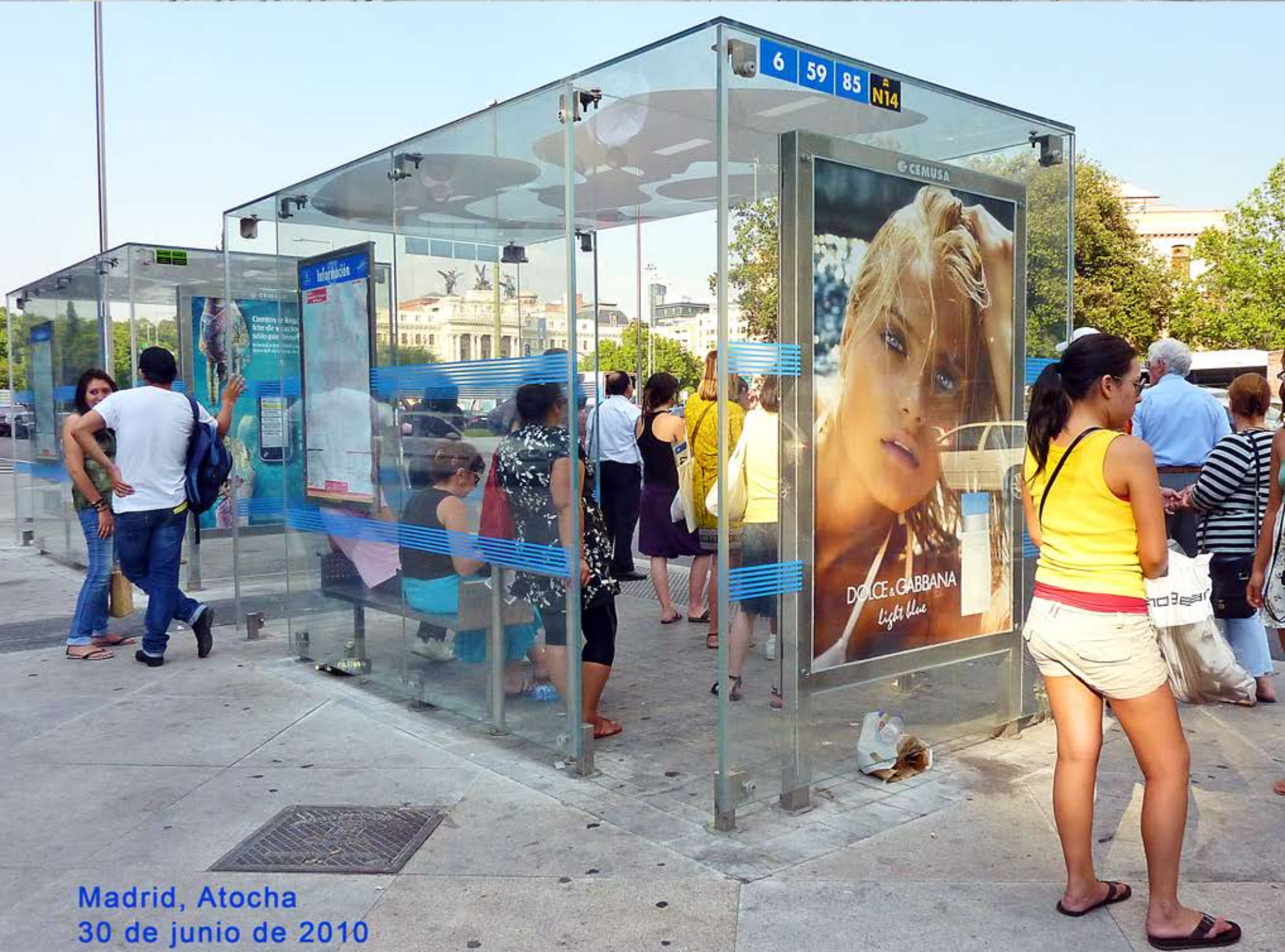
Madrid, Atocha 30 de junio de 2010